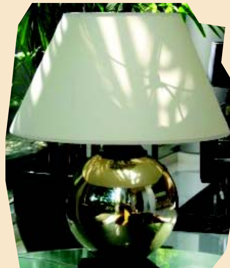
Projeto deve valorizar elementos do ambiente