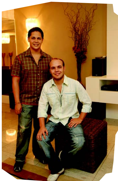
Criação da Cipriano e Martinelli Arquitetura e Urbanismo teve início na faculdade

A criatividade característica dos projetos assinados por eles ficou evidente no "Loft do Dono do Haras", ambiente que lhes rendeu o primeiro lugar no Concurso Cultural da Biancogres 2008 da última edição da Casa Cor ES.