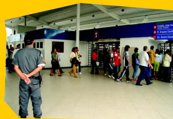
"Engenhão": porcellanato Luna Beige reveste novo mezanino da estação

O produto faz parte da Linha Alta Performance, cujas características técnicas tornam as referências que a compõem ideais para ambientes marcados pelo tráfego intenso de pessoas.